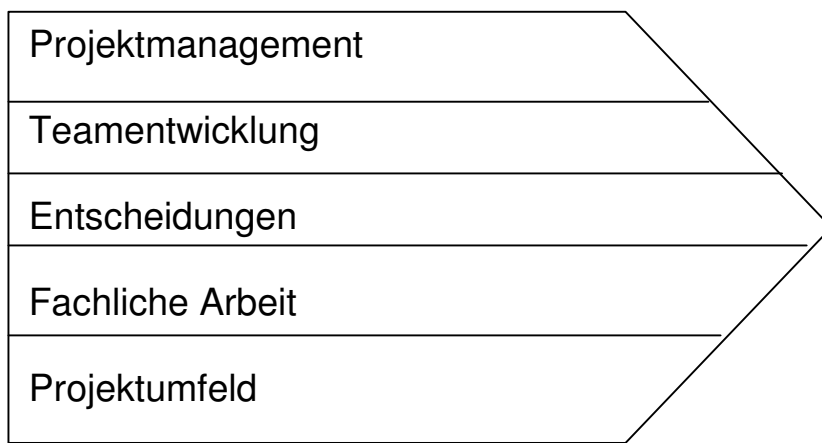
Abbildung 2: Die fünf Verantwortungsbereiche eines Projektleiters

Um die Welt eines Projektleiters zu verstehen, hat sich ein einfaches Modell seiner Verantwortungsbereiche bewährt. Seine Aufgaben lassen sich als Verantwortung für fünf parallel laufende und voneinander abhängige Prozesse beschreiben: